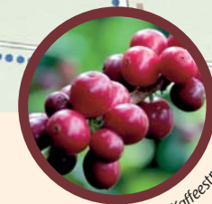
Frucht des Kaffeestrauchtes

So und nicht irgendwie jetzt und nicht irgendwann hier und nicht irgendwo möchte ich den Moment genießen.