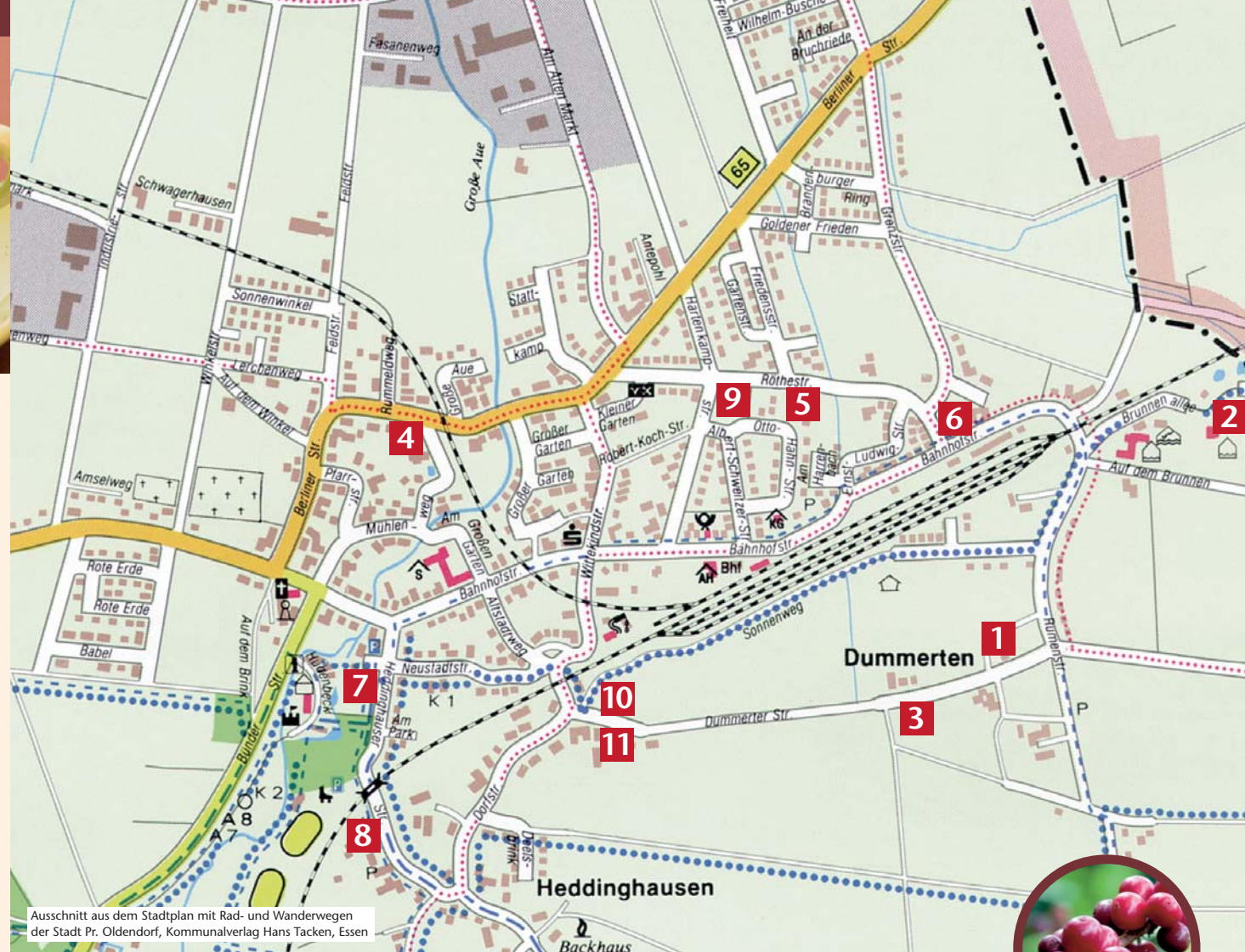
Ausschnitt aus dem Stadtplan mit Rad- und Wanderwegen der Stadt Pr. Oldendorf, Kommunalverlag Hans Tacke, Essen