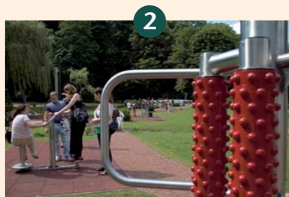
Bewegungspark für Jung und Alt im Kurpark