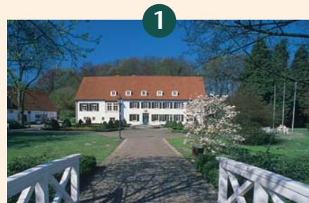
Haus des Gastes

Sportliche Route mit steilen Anstiegen zu Anfang. Teils mit kurzen Asphaltstrecken.