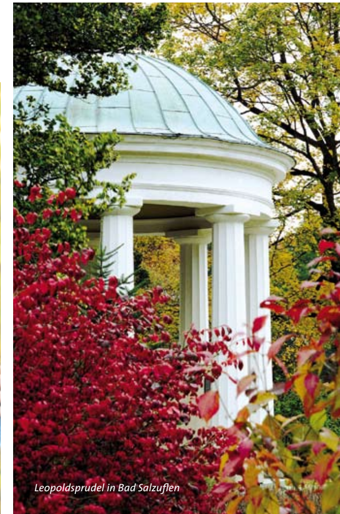
Leopoldsprudel in Bad Salzuflen