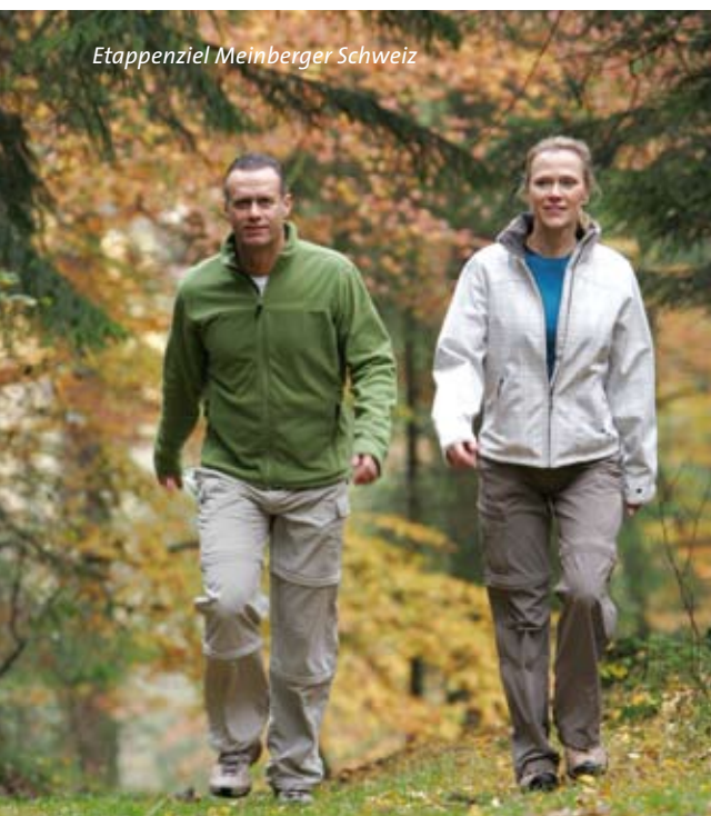
Etappenziel Meinberger Schweiz

Das einzige Privatbad Deutschlands bietet das gewisse Extra für Ihr Herz und Ihren Kreislauf.