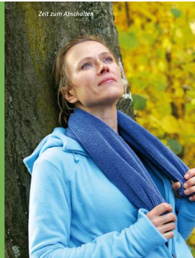
Zeit zum Abschalten

Urlaubsgäste wird die Auswahl der Angebote zur individuellen Gesunderhaltung und körperlichen Stärkung und Entspannung immer größer.