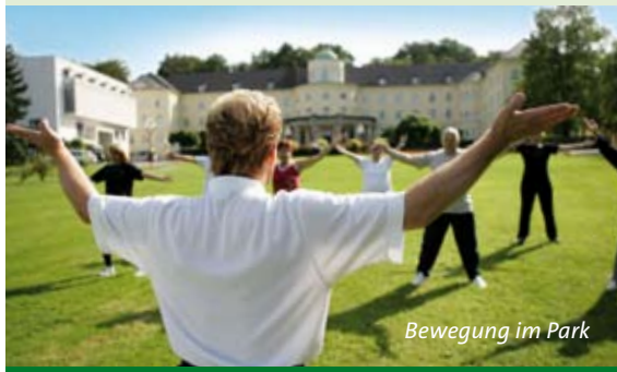
Bewegung im Park

Bad Driburg ist traditionsreiche Glasstadt. In der Schauglashütte und im Glasmuseum können Besucher mehr über die lange Tradition der Bad Driburger Glasbläser und die bekannten Bad Driburger Glasmarken „Leonardo“, „Walther Glas“ oder „Ritzenhof & Breker“ erfahren. Infos: www.bad-driburg.com