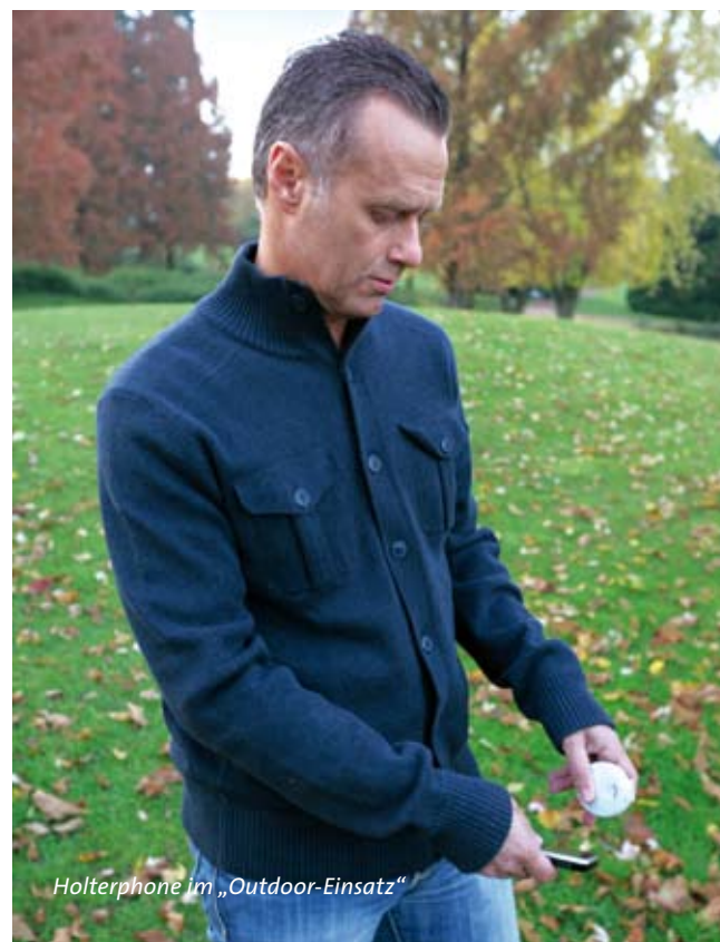
Holterphone im „Outdoor-Einsatz“