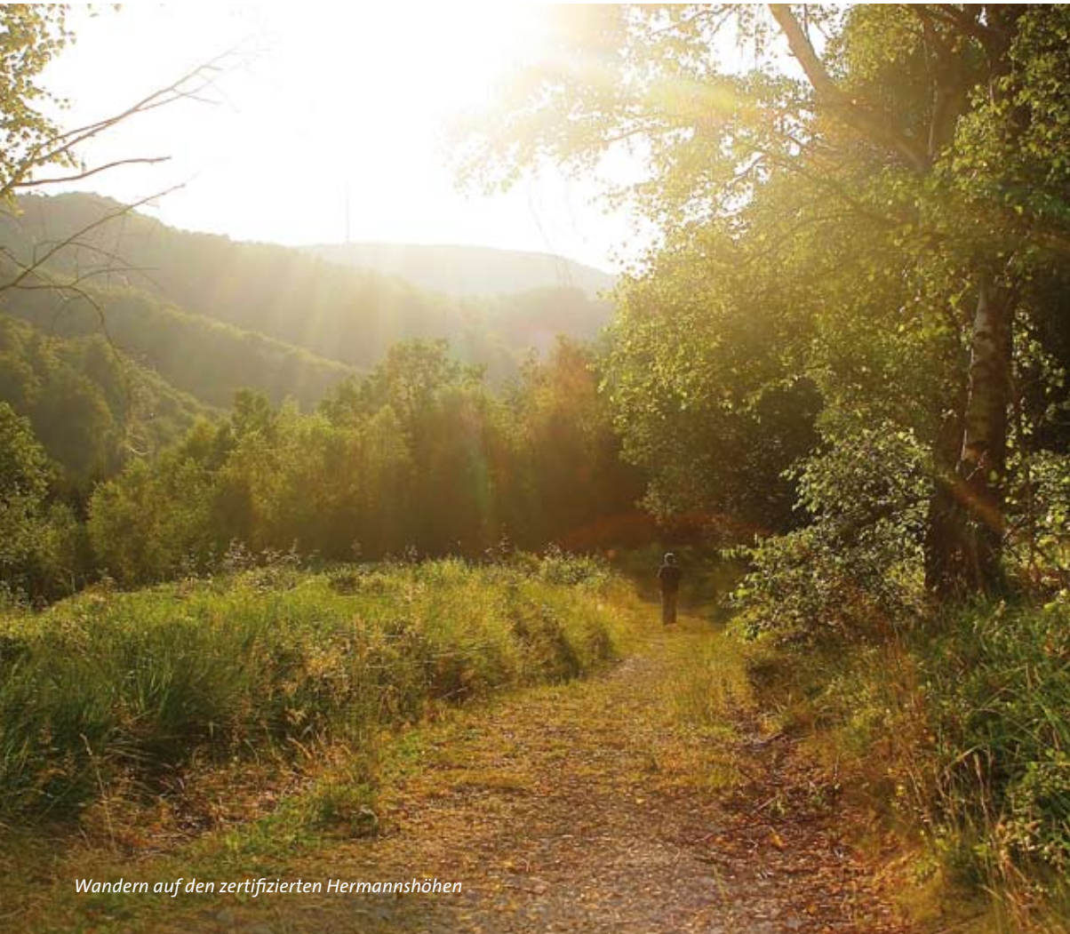
Wandern auf den zertifizierten Hermannshöhen